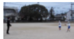
3年生のキャッチボール風景

始業式でのお披露目の後、各学年、順番に使用しています。私に「大谷グローブ、はめてみた!」ととても嬉しそうに話す人、また初めてグローブを手にはめる人…改めて大谷選手のすごさを感じるとともに感謝するところです。これを機に、玉小でもグローブを買い揃えました。体育の時間を中心に、グローブをつけての運動をしていきましょう。