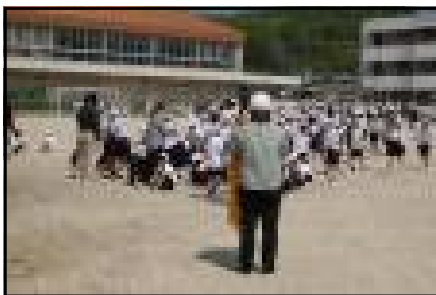
(左写真)20日・避難訓練の様子 「避難開始」連絡から全校避難完了 まで2分42秒でした。

また、21日には保護者の方にも参加していただき、引き渡し訓練を実施しました。災害はいつ発生するか予想がたちません。命を守るために、年度当初の早い内に訓練をしておいた方がよいとの判断で実施させていただきました。保護者の皆様方、ご予定の調整等ご配慮・ご協力くださり、誠にありがとうございます。