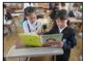
色々なミッションに挑戦しながら学校を探検 探検後には絵本の読み語り