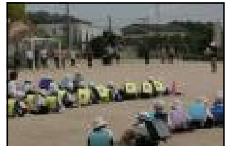
(右写真)21日・引き渡し訓練の様子

本来でしたら、今回訓練したことが役にたつような状況にならないことが望ましいですが、いざというときには、大人・子どもに関係なく、自分の命は自分で守らなければならない状況になるかもしれません。各ご家庭でも、避難経路・備蓄品・避難時の家族の約束や連絡方法など、万が一への備えとしてご確認ください。