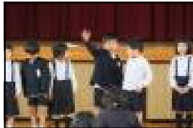
【6年生のお手本みたいに上手にできたよ】