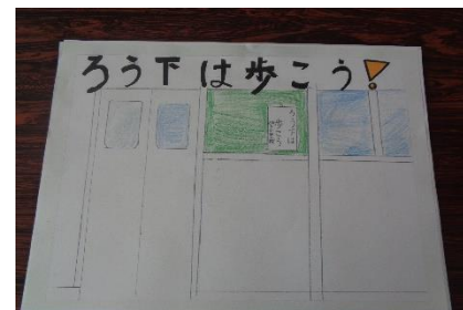
6年生作成のポスター

「こんなに考える力があるんだ。」と感心しました。児童のこの力をいろいろな場面で発揮できるように、教職員が考えていく必要性を感じました。