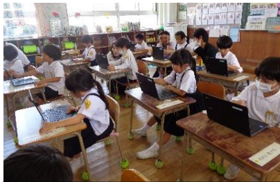
初めのプログラミング（1年）

1年生。すべてのことが初めての小学校生活を楽しく、そして落ち着いて、友達と仲よく生活ができています。先生のお話も良く聞いていて、勉強も頑張っています。朝顔のお世話をよくして、きれいな花がいっぱい咲いています。