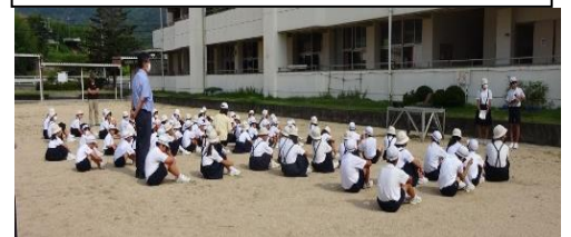
7月の児童朝会の集合の様子