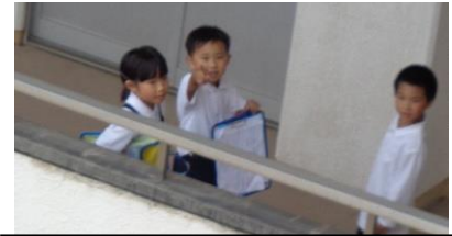
優しくできた学校探検（2年）

2年生。校門での朝の挨拶が元気にできていて、遠くから「おはようございます」という声にいつも元気をもらっています。また、学校探検の時には、1年生のお兄さん、お姉さんとして、優しく説明したり行動したりすることができていました。