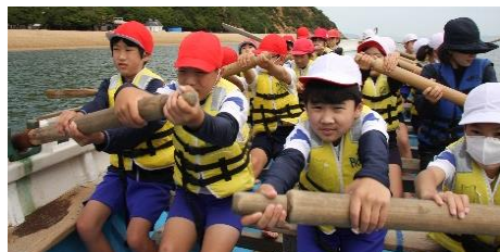
力を合わせたカッター研修（5年）