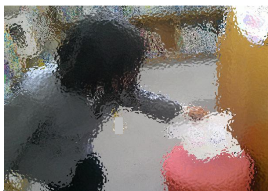
図書館のあちこちに隠れている「パンどろぼうをさがせ！」