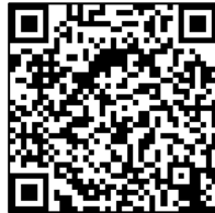
メディアで 紹介された荘内中