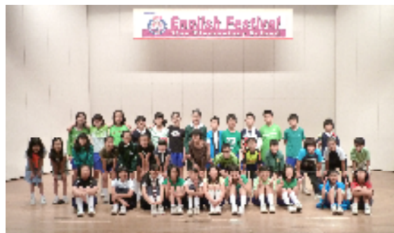
みんなのためにがんばった英語集会ボランティアのすてきな子どもたち！

「英語集会を成功させようと、一生懸命に頑張ってきた子どもたちに大きなパワーをもらいました。」など心温まるたくさんのご感想をありがとうございました。