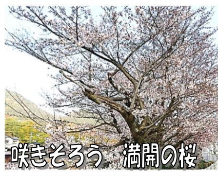
咲きそろそろ 満開の桜